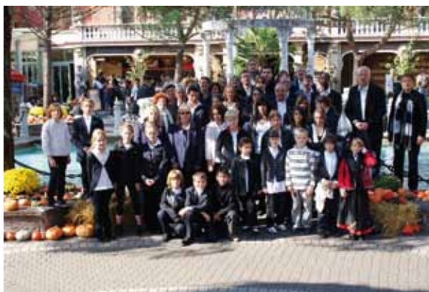
Les musiciens à Europapark

L'année 2011 sera particulièrement riche en événements musicaux, car l'Harmonie fête ses 150 ans.