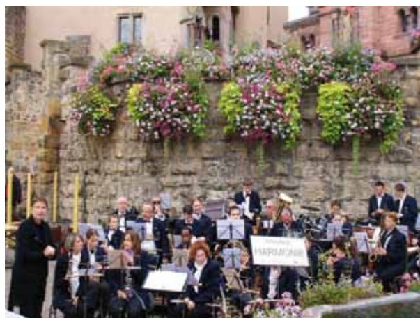
L'Harmonie en concert à Eguisheim

Les musiciens de l'Harmonie et les élèves de la classe d'orchestre de l'école de musique ne s'ennuient pas ; depuis le mois de septembre, ils donnent 1, voire 2 concerts par mois au grand plaisir des auditeurs. Ainsi, en septembre, ils ont joué à Eguisheim pour la fête du vin nouveau.