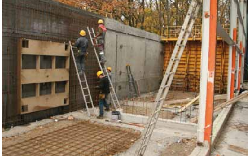
L'extension du Coscec

de l'année. La couverture de la grande salle est réalisée et celle de la petite salle associative va être posée courant des mois de décembre et de janvier ainsi que la mise en place du bardage. Si la météo hivernale le permet le chantier sera achevé comme prévu pour la fin de l'été 2011.