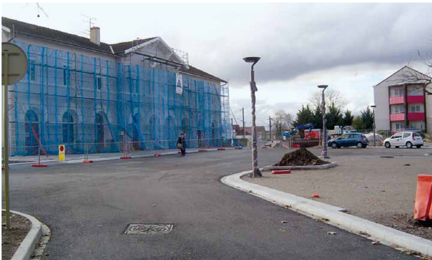
Le ravalement de la façade de la gare

Les travaux structurant dans la commune se poursuivent comme c'est le cas pour le Cosec ou s'achèvent comme pour le périscolaire et la salle des associations ainsi que pour les abords de la gare.