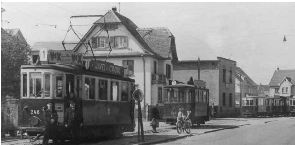
Le terminus de la rue du Général de Gaulle vers 1950

d'après les recherches de Robert Salomon