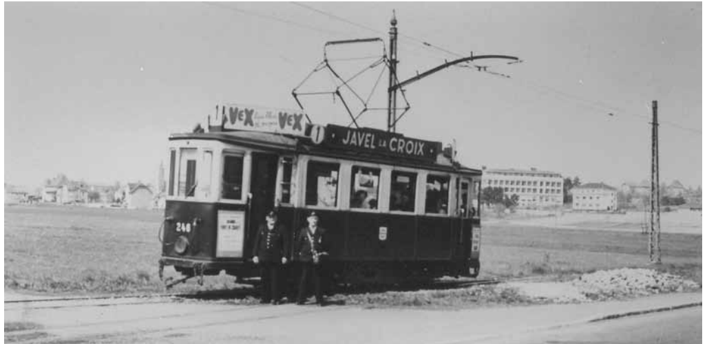
En 1954 les conducteurs posent devant l'un des derniers tramways (au fond, le Centre Lalance)

De là, elle est prolongée en 1893 jusqu'au pont sur la Doller pour desservir l'usine Schaeffer de Pfastatt-le-Château. Les lutterbachois ont donc un kilomètre à franchir pour être ensuite brinqueballés dans un tramway qui crache fumée et vapeur, grince sur ses rails, noircit les maisons des riverains, effraye les chevaux... et qu'ils surnomment « Glettisa » (fer à repasser).