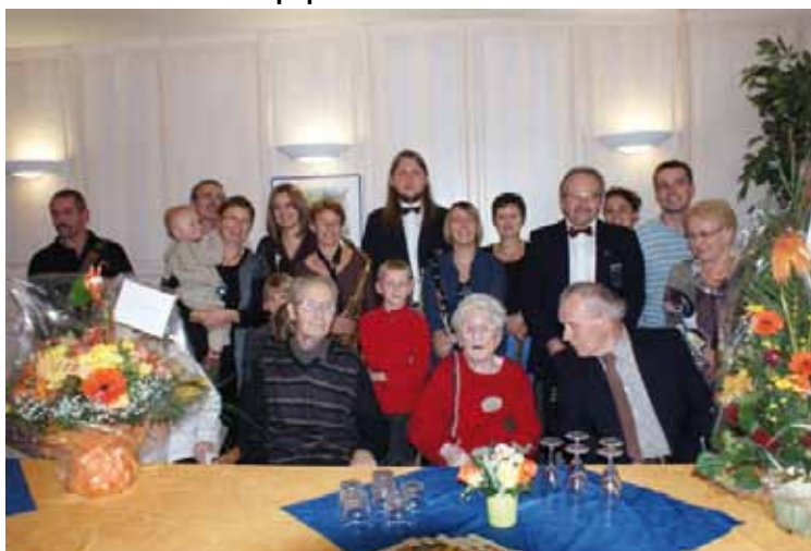
Un hommage en musique pour les 100 ans de Mme Anthony