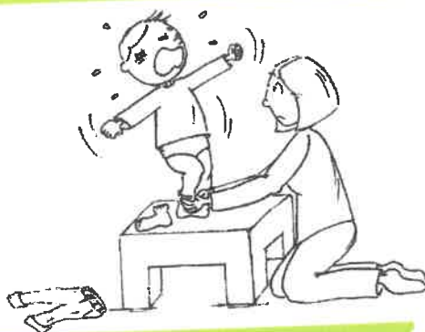
Illustration tirée du livre « J'ai tout essayé » d'Isabelle Filliozat.

Les cafés des parents sont gratuits, ouverts à tous. Le jeudi matin les enfants non scolarisés sont les bienvenus, le café des parents ayant lieu pendant le temps d'accueil. Le samedi matin, si vous le pouvez, venez sans vos enfants, les échanges et la pratique en seront facilités.